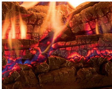
Brûleur en céramique