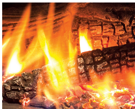
Ensemble de bûches haute définition