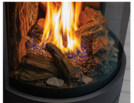
Design moderne et courbé