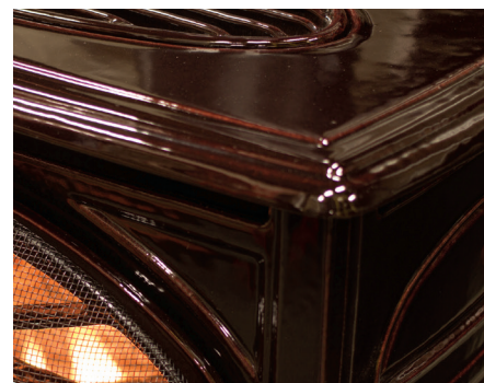
Finition marron antique émaillée