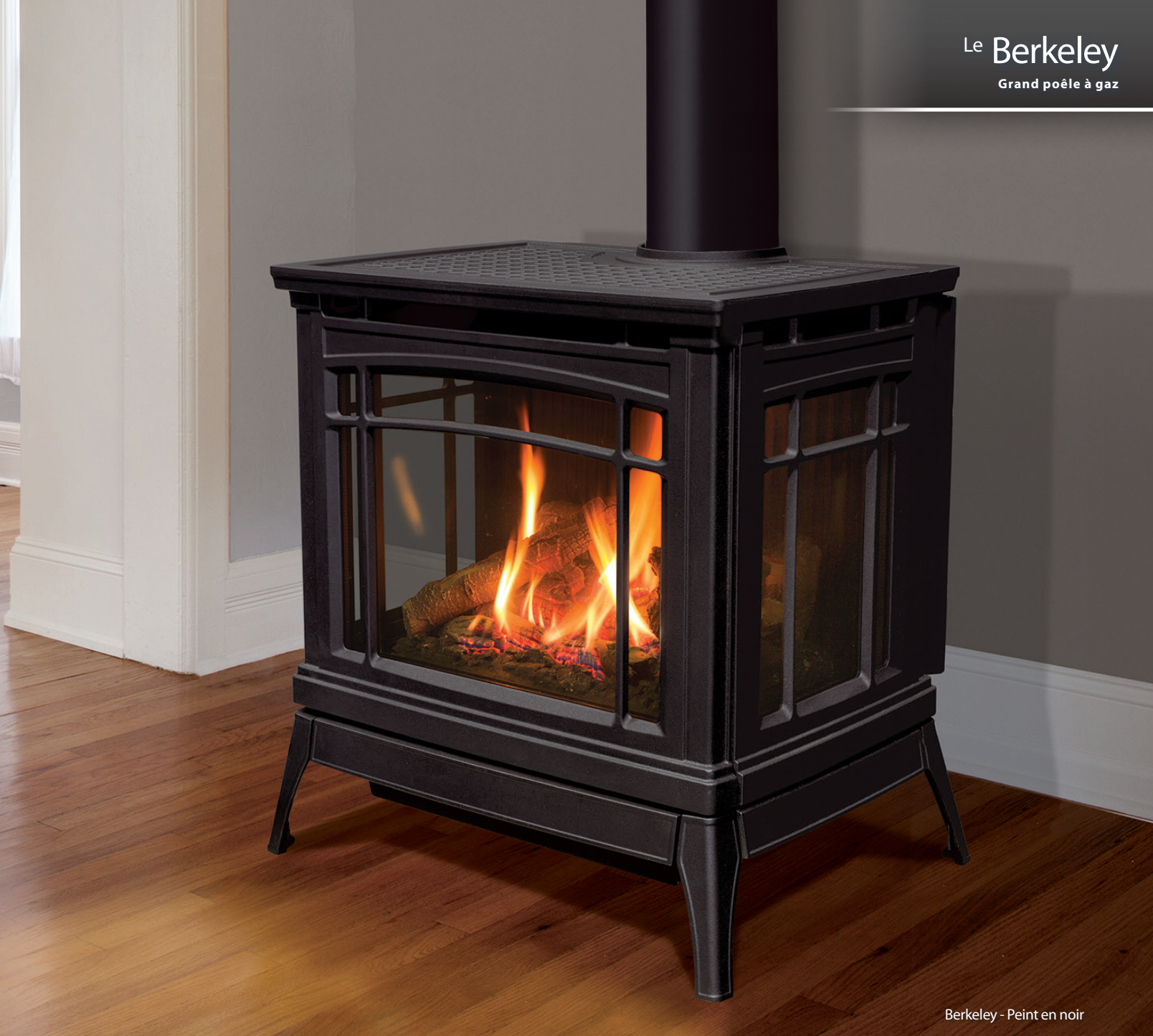
Berkeley - Peint en noir