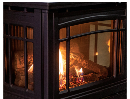
Flamme visible de trois côtés