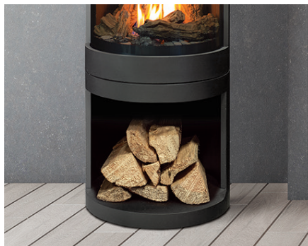
Piédestal en bois