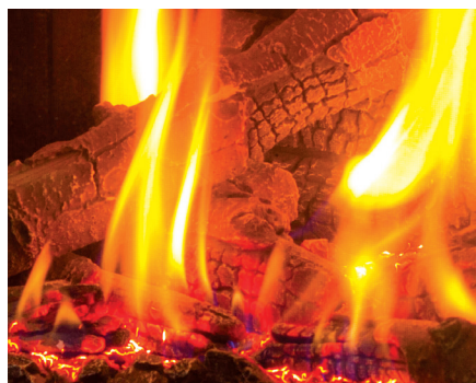
Ensemble de bûches 9 pièces ultra haute définition