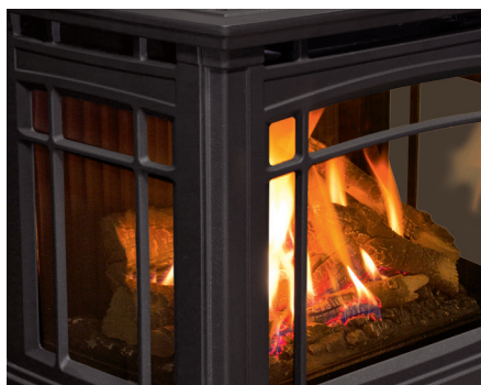
Flamme visible de trois côtés