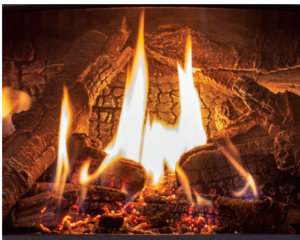
Ensemble de bûches 8 pièces ultra haute définition