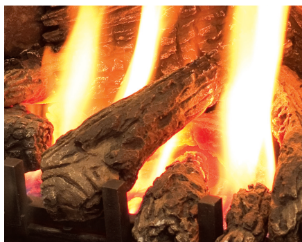
Ensemble de bûches haute définition