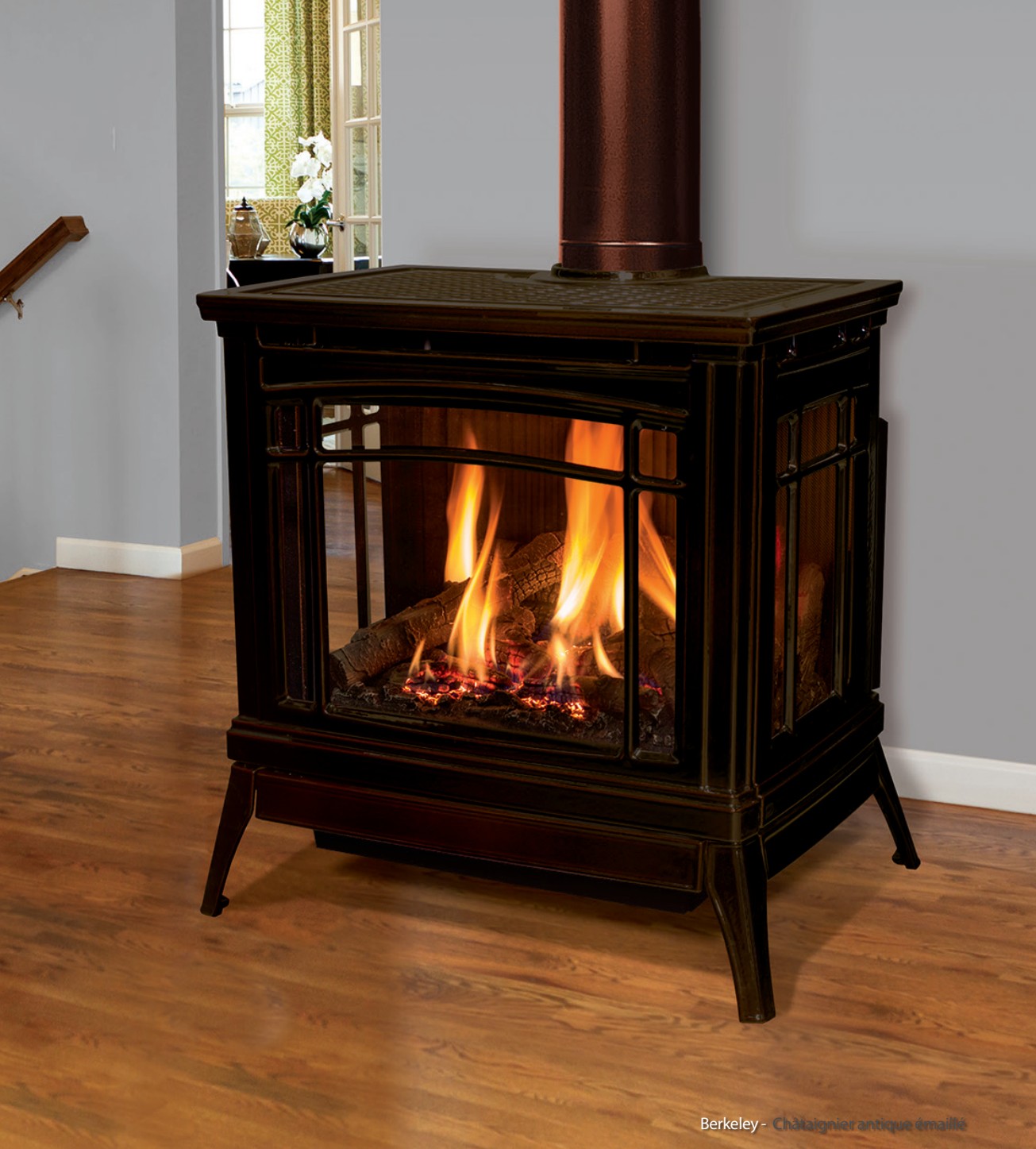
Berkeley - Châtaignier antique émaillé