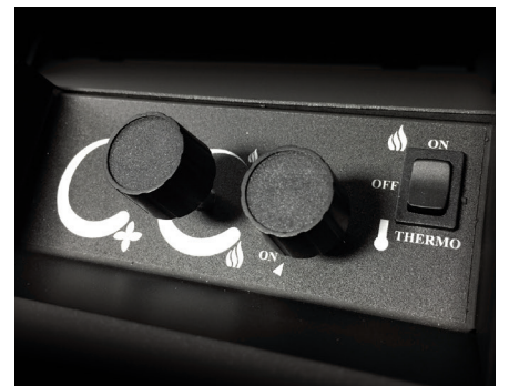
Contrôles d'accès faciles