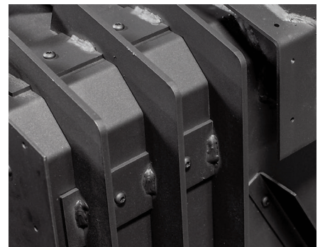
Échangeur de chaleur robuste