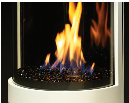
Brûleur en verre