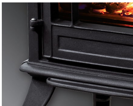
Portes en fonte