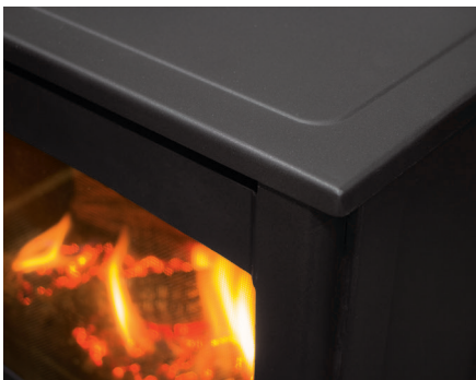
Construction extérieure en acier moulé