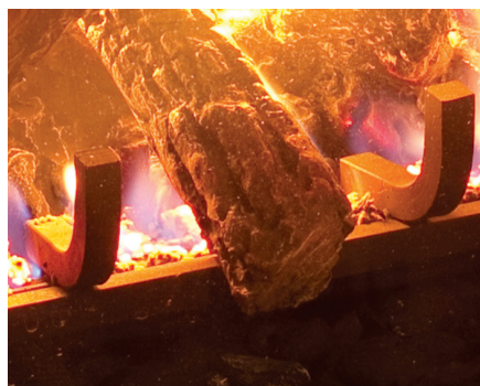
Grille de cheminée en acier