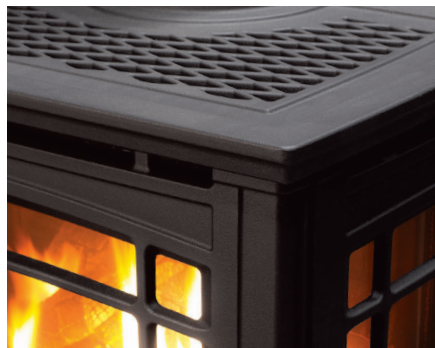
Fonte européenne - Peint en noir