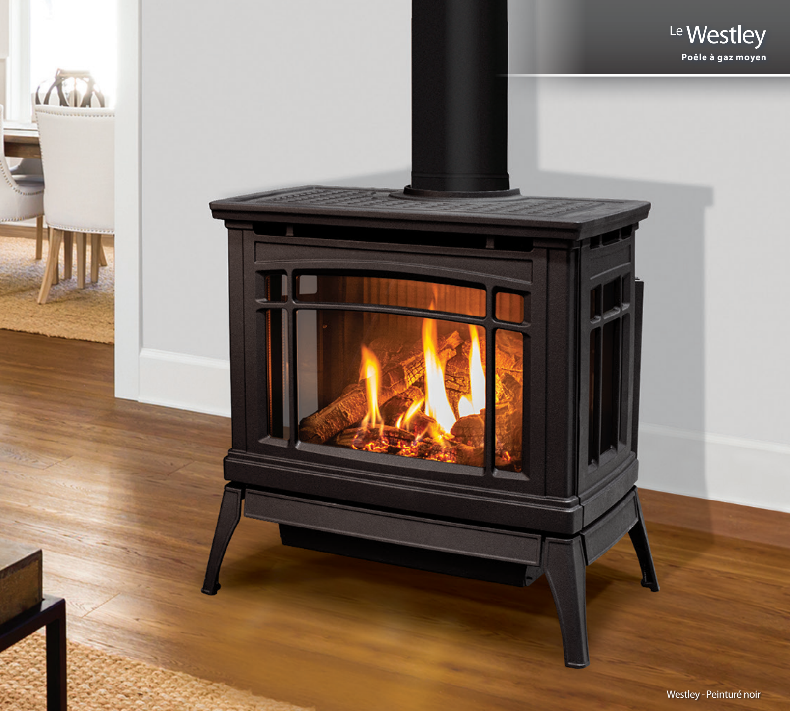
Westley - Peinturé noir