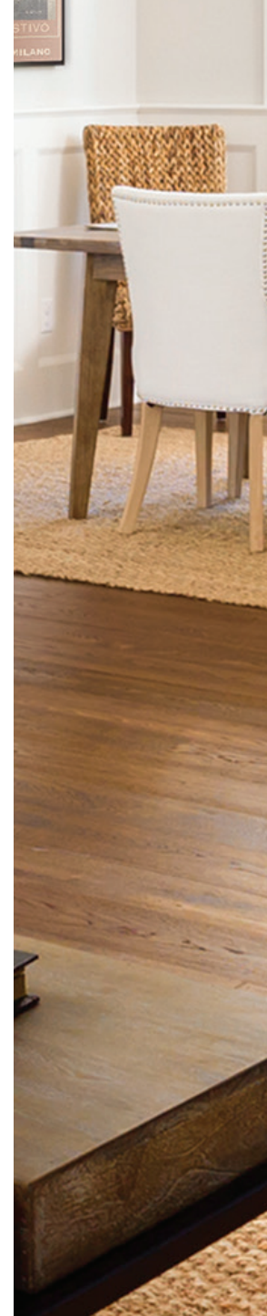
Westley - Bronze antique