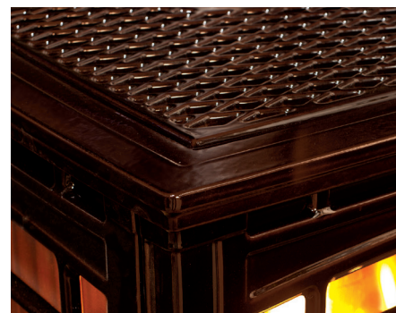
Moulages européens - châtaignier antique émaillé