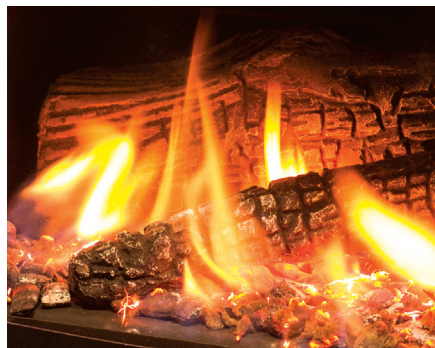
Ensemble de bûches haute définition